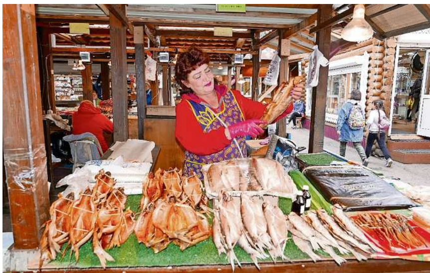
Reichlich Fisch. Am Baikalsee haben Fischer meistens gute Fänge. Ein Teil des Fangs wird geräuchert und anschliessend auf dem Markt verkauft.