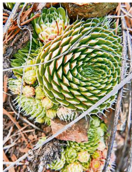
Kurze Blütezeit. Trotz des langen Winters ist die Artenvielfalt gross.